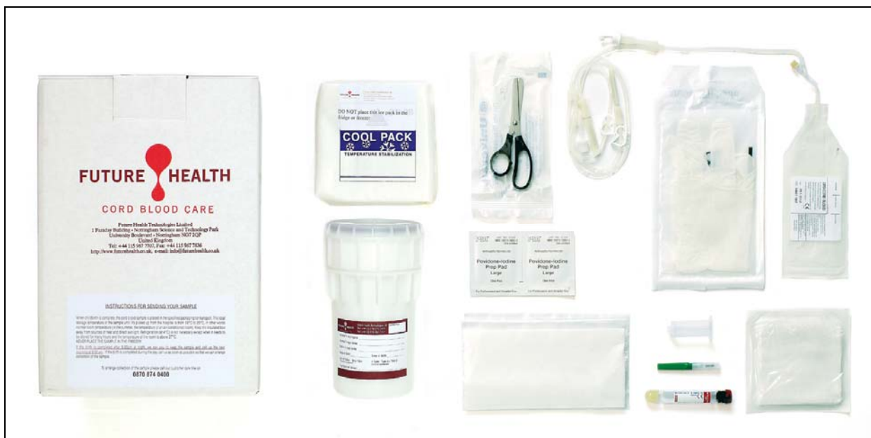
KIT FUTURE HEALTH PER LA RACCOLTA DI SANGUE CORDONALE (fornito da: Pall Medical Blood Collection System)